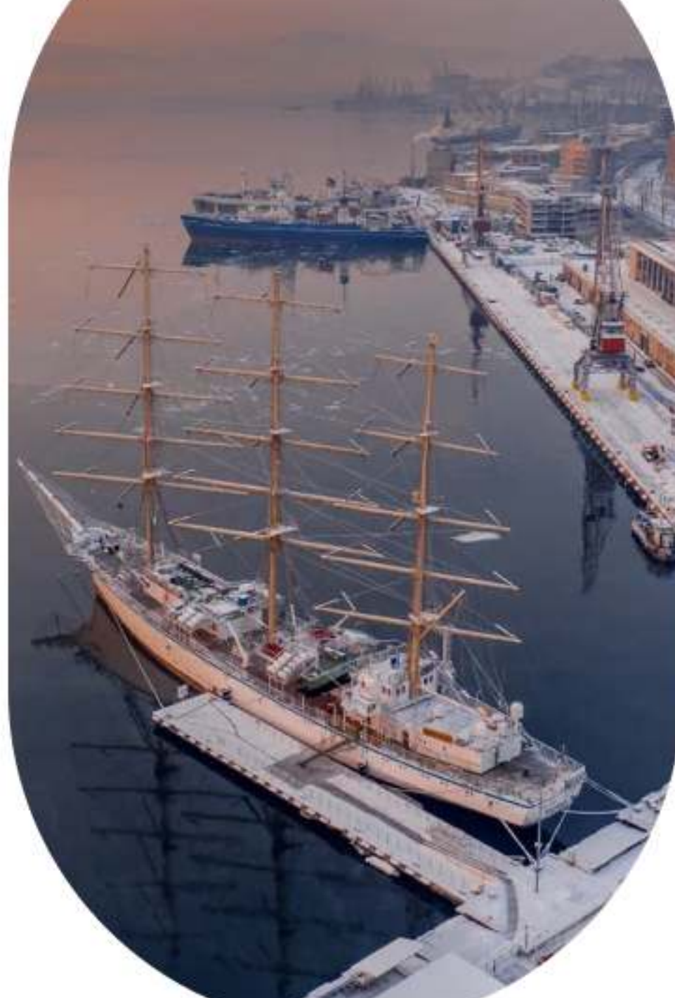
Автор: Антон Блохин

В 1860 году на месте нынешнего Владивостока начали строить небольшой военный пост. Тогда почтовая служба возила письма и посылки только до Хабаровска. Почтовое сообщение между Хабаровском и Владивостоком было налажено к 1862 году. В распутицу, весной и осенью, дороги размывало, и несколько месяцев добраться до поста было невозможно — эти периоды называли владивостокскими почтостояниями. Единственным каналом связи с остальной страной тогда оставались военные корабли, которые, обогнув Европу, Африку и Азию, прибывали сюда из Петербурга.